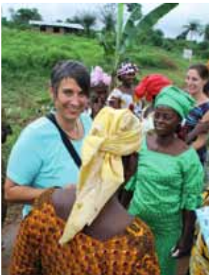
Monika Hauser, Gründerin und geschäftsführendes Vorstandsmitglied von medica mondiale e. V. in Köln, ausgezeichnet mit dem Alternativen Nobelpreis 2008:

Unser Erfolg beruht auf unserer wertgebundenen Unternehmenskultur, die geprägt ist von Achtsamkeit und Engagement. Als globales Unternehmen mit indischen Wurzeln stellen wir uns der Verantwortung für die „Eine Welt“.