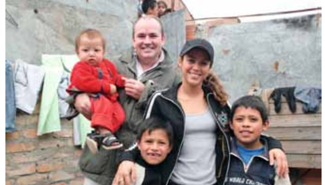
Wolfram M. Kons, Moderator des „RTL-Spendenmarathon“:

Viele Menschen mit Zuwanderungsgeschichte können und wollen sich in Köln engagieren. Das Netzwerk „Eine-Welt Stadt Köln“ bietet gute Gelegenheiten, die speziellen Kenntnisse und Fähigkeiten von Menschen mit transkultureller Erfahrung einzubringen.