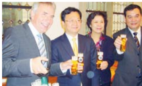
新市长上任后接待的第一批外国客人就是来自中国陕西省的代表团。市长用啤酒款待中国客人。左起：科隆市长罗特斯、陕西省副省长景俊海、陕西省商务厅长李雪梅和陕西省工商管理局局长李忠为

以科隆市为中心，在方圆100公里的范围内有1700万居民，这里有在整个欧洲无与伦比的销售市场和和首屈一指的交通网络。