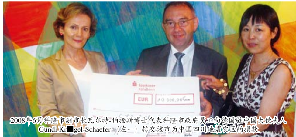
2008年6月科隆市副市长瓦尔特-伯扬斯博士代表科隆市政府员工向德国驻中国大使夫人Gundi Krügel-Schaefer（左一）转交该市为中国四川地震灾区的捐款