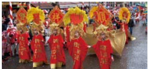
2008年2月科隆市北京风情舞动 北京代表团参加科隆狂欢节，为整个狂欢节队伍打头阵，宣传北京奥运

在北京奥运会期间，科隆首席市长施拉玛和副市长瓦尔特-伯扬斯博士率团共赴中国出席、参观。访华期间科隆代表团在西安的一场招商大会上与陕西省政府签署了《科隆与陕西省经济合作协议》。在北京，双方的经济促进局也达成了合作意向。科隆市长施拉玛在北京期间还访问了科隆大学的伙伴学校——中国政法大学。通过频繁的学术交流两所大学保持了友好密切的合作关系。当时有不少来自科隆的大学生在政法大学参加暑假交换活动。