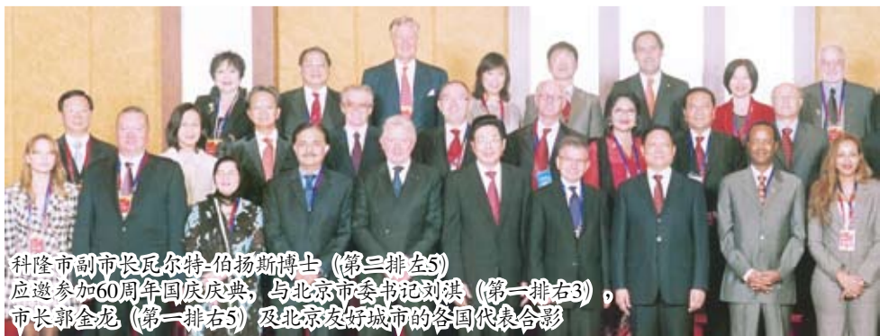
科隆市副市长瓦尔特-伯扬斯博士（第三排左5）应邀参加60周年国庆庆典，与北京市委书记刘淇（第一排右3），市长郭金龙（第一排右5）及北京友好城市的各国代表合影

施拉玛市长今年访问中国的第二站是长沙市。位于这里的中国最大的机械制造企业之一的“三一重工”股份有限公司在2008年5月就在科隆设立了子公司。访问团与三一集团公司的领导举行了会谈。此后，施拉玛市长先行回到科隆，而科隆市经济促进局的代表们则继续前往厦门，参加了在那里举行的第13届中国国际投资贸易洽谈会。科隆代表团成员在会上邀请了对国外事务感兴趣的媒体代表及中国企业家参加了科隆的城市展示