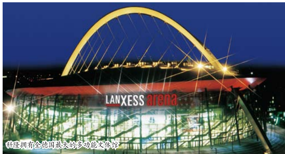
科隆拥有全德国最大的多功能体育馆

.....为企业健康发展及壮大提供了源源不断的动力。在这里您可以找到高素质的各类专业型人才。这些人都拥有高等学府的毕业文凭，来自于“双轨系统”教育体系的一些既具备理论知识，又具备实践经验的专业人才不断地为工业、贸易以及服务业提供新鲜的血液。这里的数所国际学校注重从小培