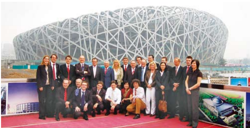
2007年9月,为庆祝北京与科隆结为友好城市20周年,科隆市长率领科隆经济代表团访问北京,并在鸟巢前合影

这个行动的目标是,将科隆打造为中国经济进军德国乃至整个欧洲的桥头堡。通过与中国的商务往来巩固这座以大教堂闻名于